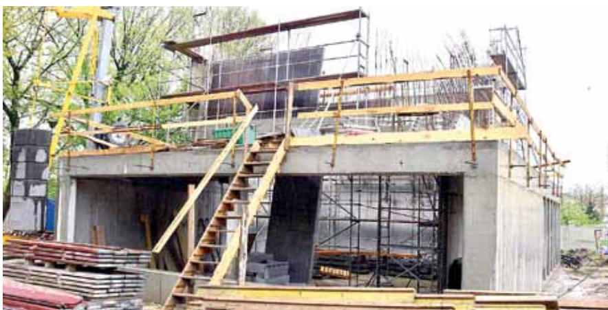
Pnący się w górę budynek budzi coraz większe zainteresowanie.

Budowa centrum wspinaczki górskiej prowadzona jest w ramach zadania inwestycyjnego pn. „Zbudujemy razem ścianę – niech połączy nas wspinanie”. Zakres prac, których efekty już widać, obejmuje stan surowy zamknięty budynku, w którym centrum wspinaczki ma zostać zorganizowane. Jak informuje Wydział Techniczno-Inwestycyjny i Drogownictwa Urzędu Miasta Tarnobrzega, zaplanowany na 2 maja termin zakończenia budowy centrum został przesunięty ze względu na wystąpienie niekorzystnych warunków atmosferycznych. Długotrwałe opady deszczu, a także utrzymująca się nocami ujemna temperatura uniemożliwiły prowadzenie robót z użyciem betonu, którego wiązanie w takich warunkach jest znacznie utrudnione. Aktualny termin zakończenia robót został ustalony na 30 czerwca. Wartość inwestycji wynosi 646 997 złotych.