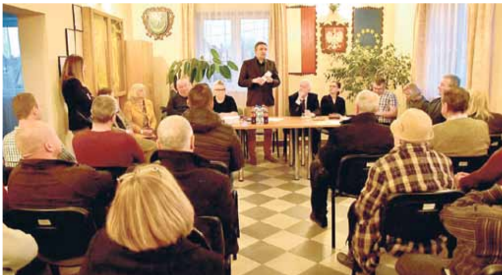
Spotkanie z mieszkańcami osiedla Miechocin.

Podczas wszystkich czterech spotkań mieszkańcy poruszali szereg, ważnych dla ich miejsca zamieszkania spraw, m.in.: remonty kolejnych ulic, tworzenie dodatkowych miejsc parkingowych, przejęcie dworca PKP i jego