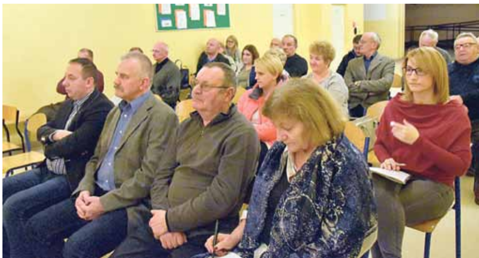
Spotkanie z mieszkańcami osiedla Siarkowiec.

nobrzесkie Wodociągi Sp. z o.o. za kwotę 25 ml zł. Pozyskane w ten sposób środki finansowe będą mogły być zainwestowane w remont ulic Żeglarskiej i Plażowej oraz dróg na terenie strefy poprzemysłowej w Machowie. Tarnobrzесkie Wodociągi Sp. z o.o. wykupią swoje akcje w ciągu 25 lat.