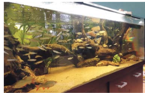
Trwa aranżacja ekspozycji w nowych pomieszczeniach Centrum Natura 2000.

Gmina Tarnobrzeg pozyskała dofinansowanie na realizację projektu pn. „Rozbudowa infrastruktury Regionalnego Centrum Promocji Obszaru Natura 2000 w Tarnobrzegu” ze środków Regionalnego Programu Operacyjnego Województwa Podkarpackiego na lata 2014-2020 w ramach osi priorytetowej IV Ochrona środowiska naturalnego i dziedzictwa kulturowego, działania 4.5 Różnorodność biologiczna. Projekt znalazł się na pierwszym miejscu listy projektów spełniających kryteria naboru i wybranych do dofinansowania.