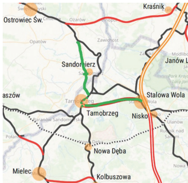
Orientacyjny przebieg fragmentu Szprychy 6 wg wizji Czwórmieścia (fragment na zielono).

Przebieg proponowany przez Czwórmieście zakłada, że nowa linia rozpocznie się w rejonie stacji Jakubowice na linii kolejowej 25, po czym będzie biegła do Sandomierza w kierunku południowym nowym śladem (równoległe do drogi krajowej nr 79). W rejonie Sandomierza powstałaby nowa stacja Sandomierz Ry-