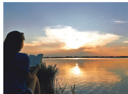
III miejsce – „Wakacyjne chwile” Natalia Jajko